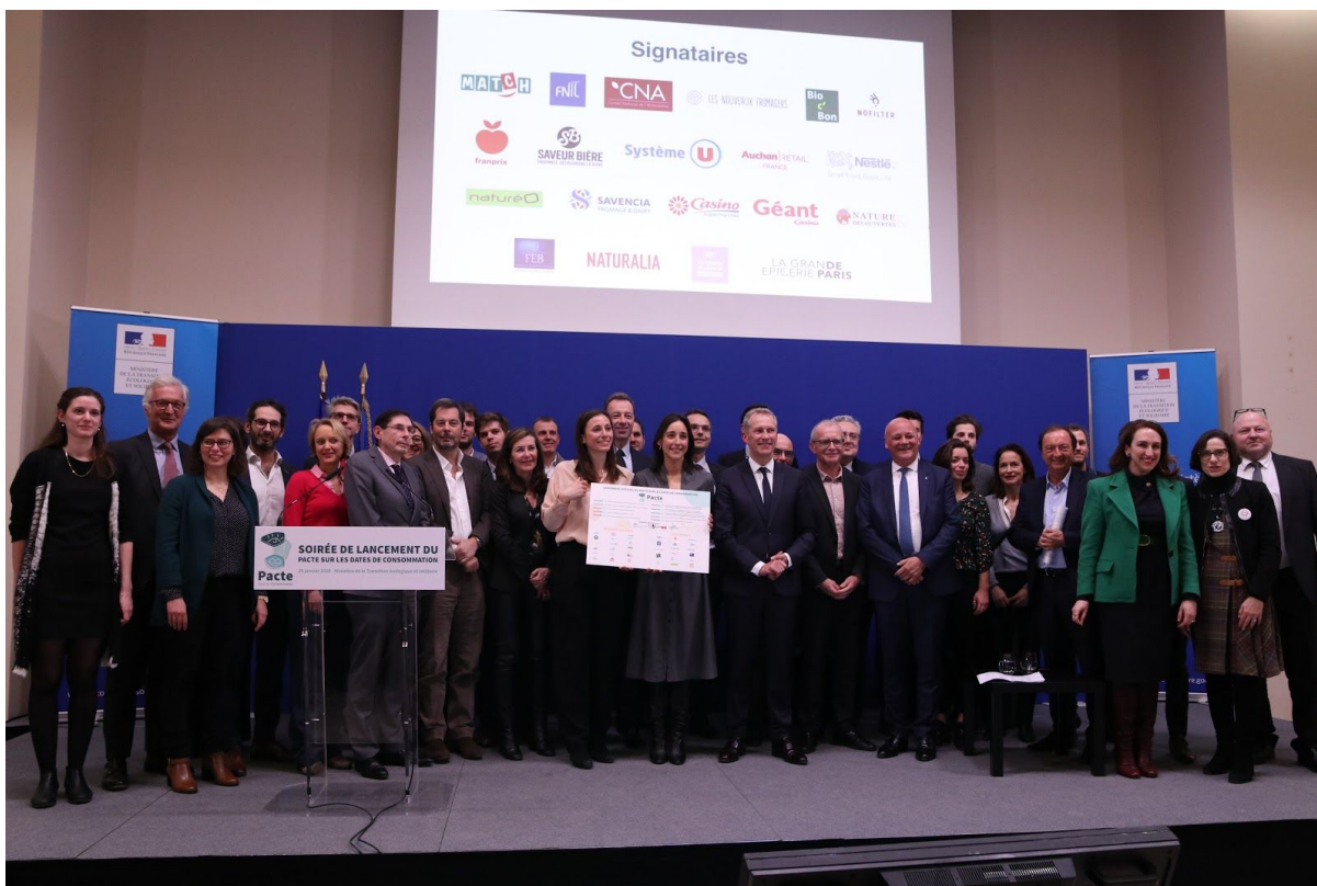
Les signataires du Pacte sur les Dates de Consommation, 28 janvier 2020, Ministère de la Transition Écologique et Solidaire

Paris, le 28 janvier 2020 - 38 acteurs de la filière alimentaire (industriels, distributeurs, fédérations et associations de consommateurs et de protection de l'environnement) présentent le premier Pacte sur les Dates de Consommation pour réduire le gaspillage alimentaire lié à ces dernières. Initié par Too Good To Go, le Pacte comprend 10 engagements ambitieux, concrets et mesurables, portant sur la gestion et la compréhension des dates de consommation. Soutenu par les Ministères de la Transition Écologique et de l'Agriculture et de l'Alimentation, l'objectif du Pacte est que l'ensemble